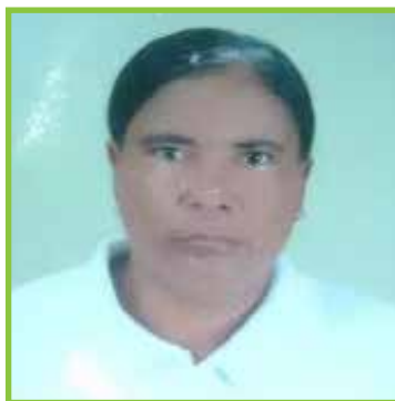
Santa Pérez 4112