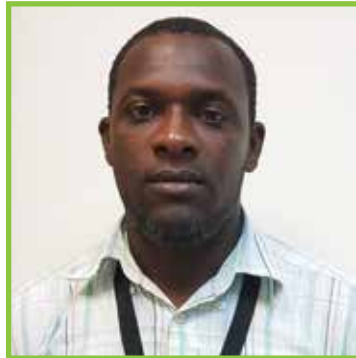
Joelix Mercedes 7815