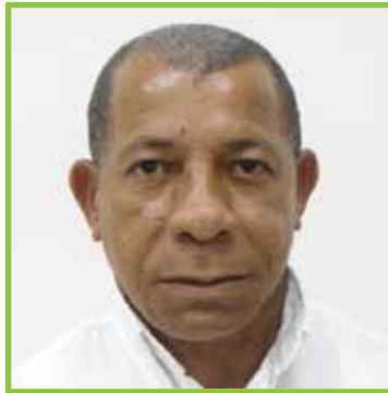
Sócrate Medrano 3745