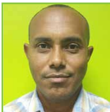
Willian Vallejo 1892