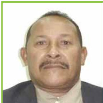
Buenaventura Suárez 2537