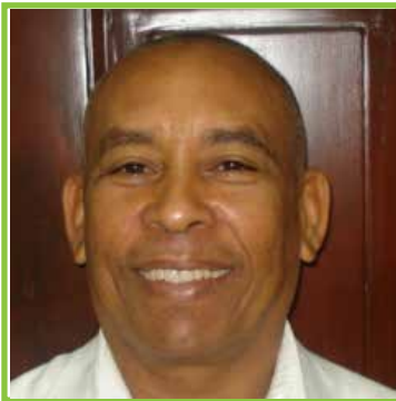
Porfirio Díaz 2808