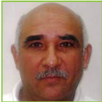
Francisco Crisóstomo 2394